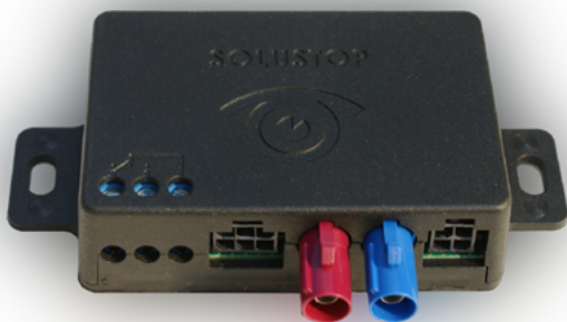
(89 x 55 x 18 mm - 43 g)